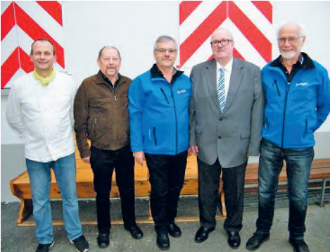
Das OK des Jahresschiessens