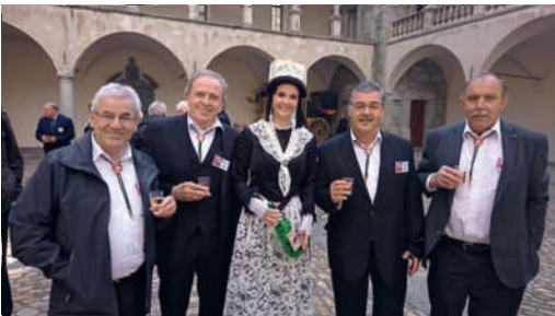
Apéro im Stockalperpalast Brig mit charmanter Ehrendame an der Delegiertenversammlung des VSSV