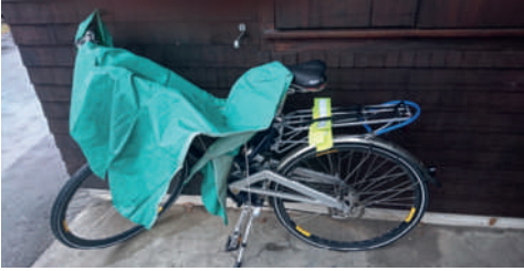
Anreise bei jedem Wetter mit dem Velo...