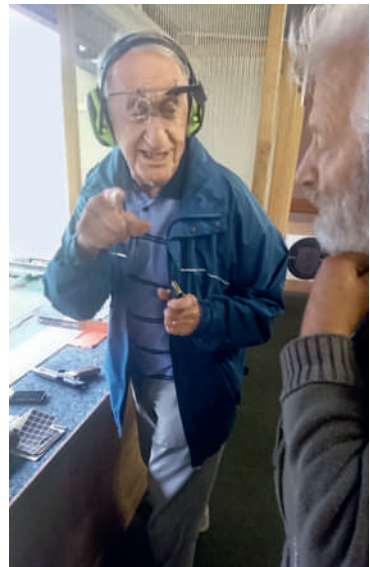
...so isch är fort...