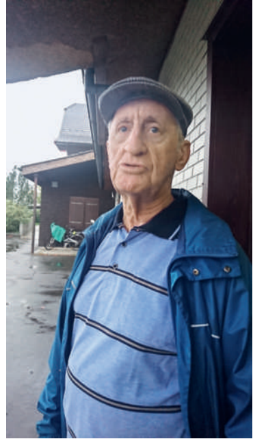
Impressionen vom Jahresschiessen Pistole 2019, Schwybogen Stans