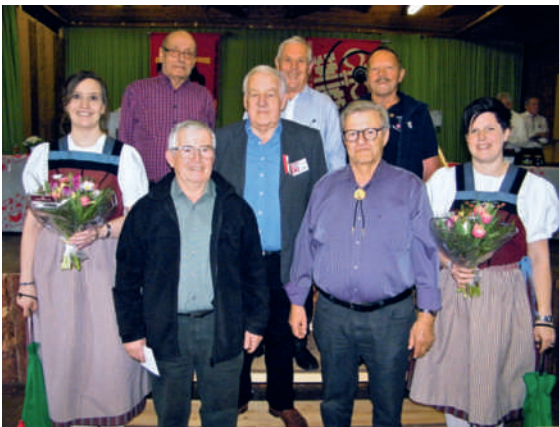
Die Gewinner der FM Auszeichnung.