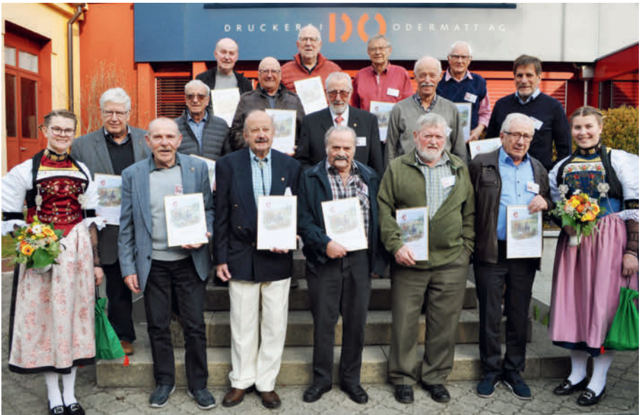
Ehrenveteranen Jahrgang 1942

Zu Ehren und der feierlichen Umrahmung der ernannten Ehrenveteranen, spielt das Trio Gemütlichkeit einen lüpfigen Ländler.