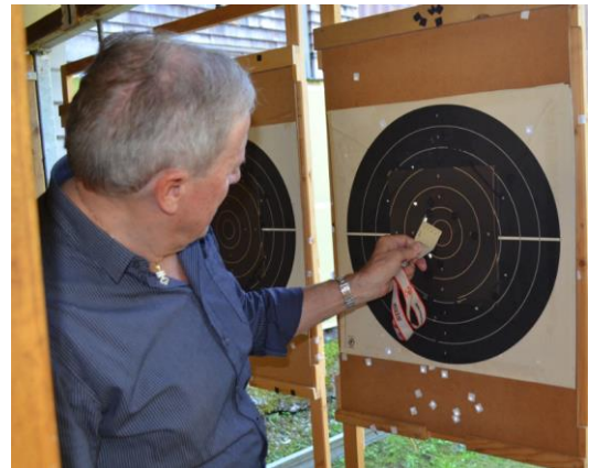
Präsident Dölf Lussi bei der Auswertung