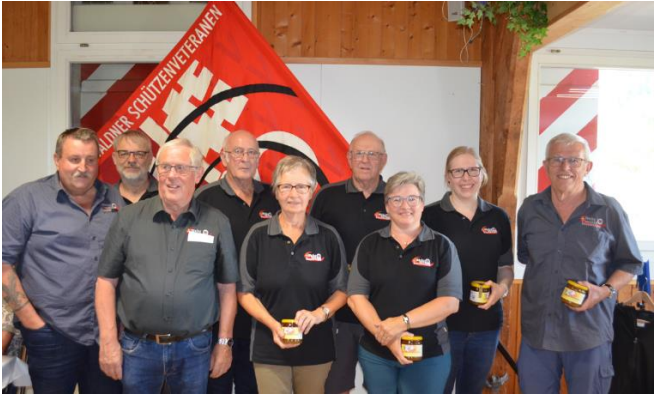
Das GV- und Jahresschiessen-OK 2023 Ennetbürgen