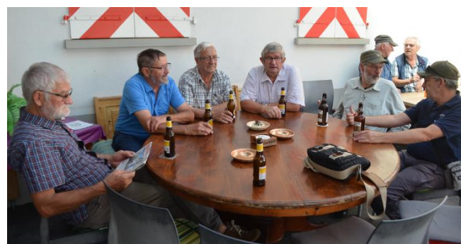
Auch die Geselligkeit und Schiessanalyse gehören dazu