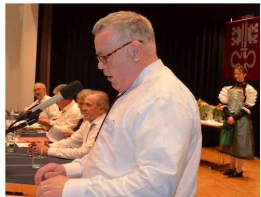
Der Schützenmeister im Element...