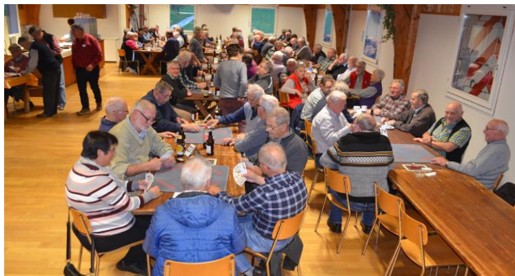
Es wird eifrig um die begehrten Fleisch- und Weinpreise gejasst.