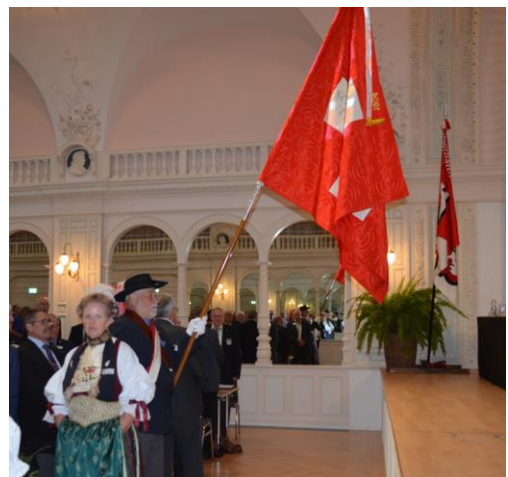
Einzug mit der Verbandsfahne des VSSV