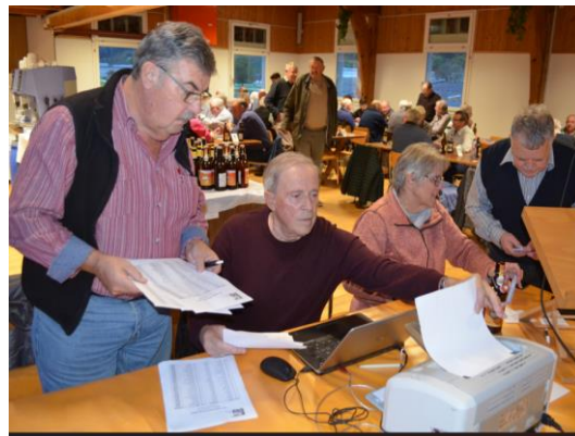
Der Vorstand beim Rangliste erstellen