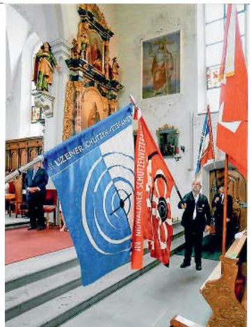
Der Fahngruss des VNSV