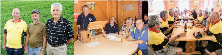
Jahresschiessen 2024 in Emmetten , Organisation durch die Veteranen Stansstad/Obbürgen