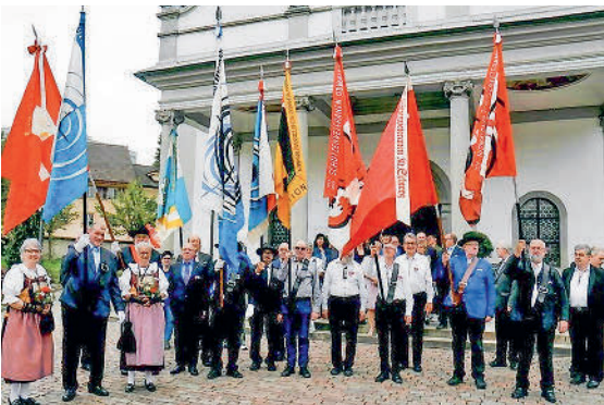
Die Fahndelegationen sind bereit

Eine Delegation des VNSV war zur Feier eingeladen.